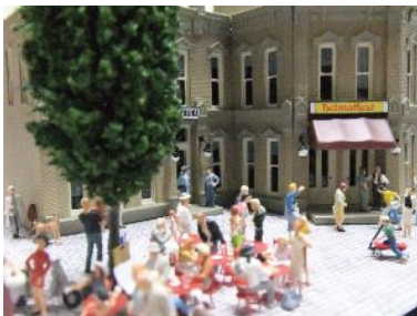
ドイツ製部品を使った町並みの風景