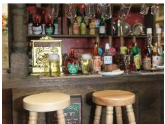
イギリス製部品を使ったパブのジオラマ