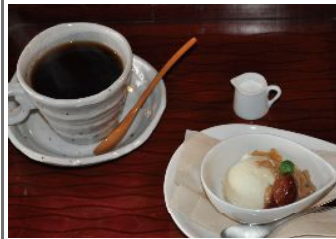
焙煎コーヒー・ アイスクリーム付で800円