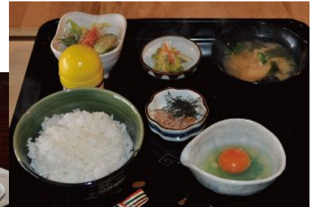
『たまごかけごはん定食』

「おてんとさん」 さぬき市田面3034(森行) 0879-43-5290 定休日 火曜日 営業時間9:00~17:00 PS:土日限定で、手づくり石釜で焼いた山菜ピザが食べれます。