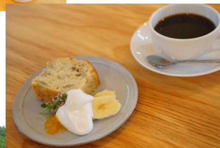
バナナパウンドケーキ+珈琲